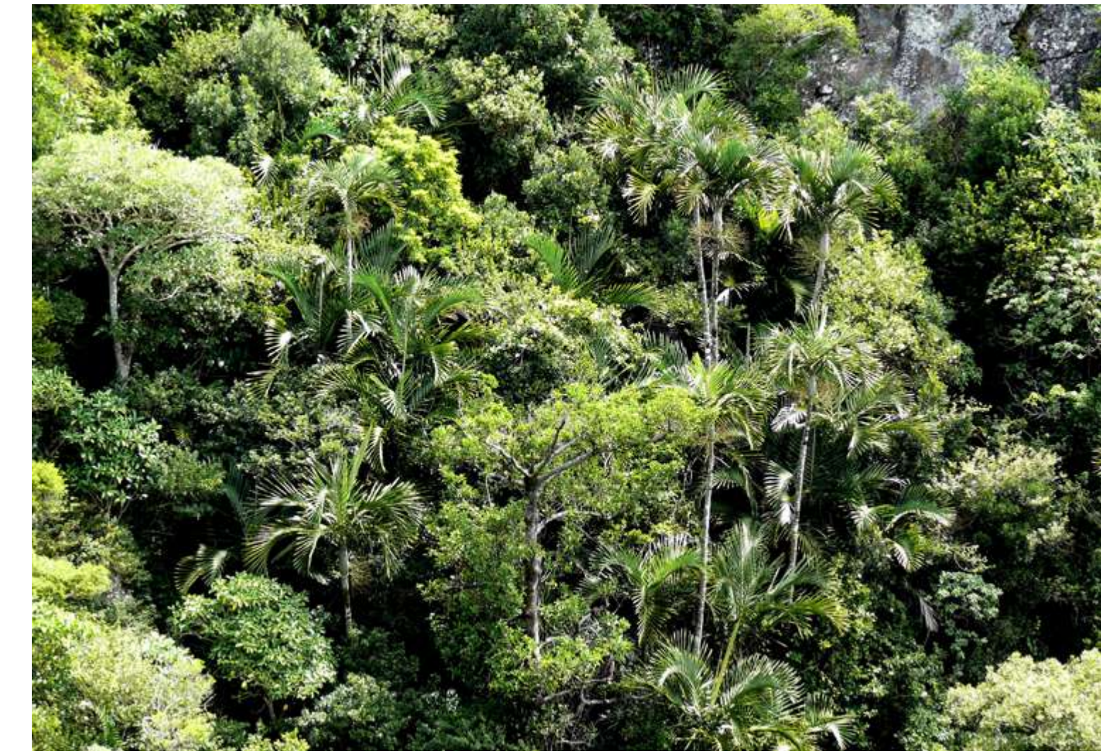
Forêt humide du nord-est de la Grande Terre - D. Ugolini

A ce jour, le RLA compte près d'une cinquantaine d'experts, mais ce sont plus de 80 spécialistes calédoniens, français et internationaux qui ont contribué à ces travaux, en accord avec la méthodologie Liste rouge éditée par l'IUCN.