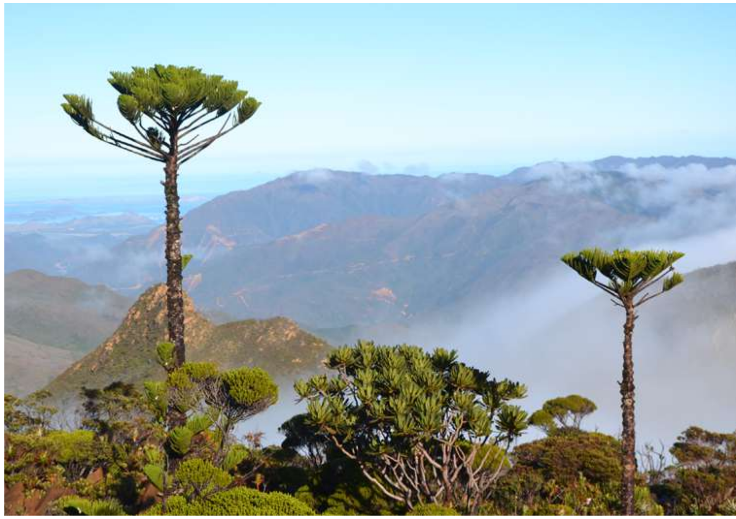
Araucaria humboldtensis J. Buchholz, 1949 - V. Tanguy

La Nouvelle-Calédonie est un hotspot de biodiversité situé dans le Pacifique Sud (Myers, 1998), reconnu pour la richesse et la diversité de son patrimoine floristique. Des quelques 3400 espèces de plantes vasculaires indigènes connues, 75% sont considérées comme endémiques du territoire (Munzinger et al., 2016).